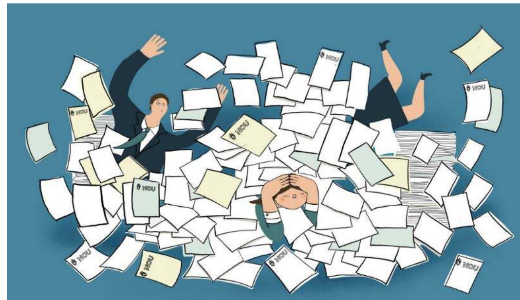
Illustrator: Stine Kaasa, Morgenbladet 25. mai 2018

«.. hvor trygt hviler politikken egentlig om byråkrater og beslutningstagere ikke leser rapportene?»